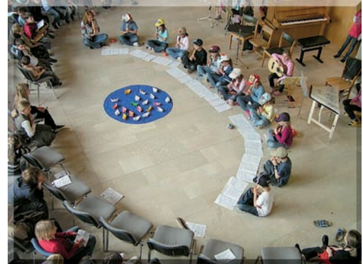
i.B. Konzert der SchülerInnen der VS Oberalm

Im April schickte das Künstlerehepaar Geißelbrecht – Toferner die Kinder der Volksschule auf eine Fantasiereise. Mit Gogoch, dem wandernden Stein (des gleichnamigen Buches), wurden Mädchen und Buben zum theatralischen Mitspielen, zum Zuhorchen und auch zum Lesen aufgefordert. Das sorgte für Stimmung, als selbst ein paar Lehrerinnen zeigen mussten, ob sie als Darstellerinnen von Steinen eine