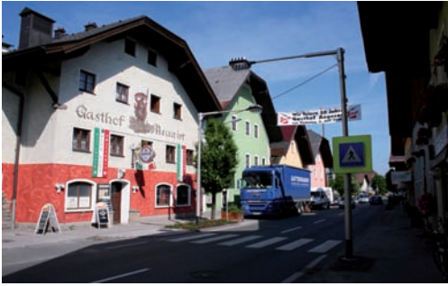
i.B. Neue Schutzwegbeleuchtung entlang der L105

Immer wieder kommt es speziell in der Dunkelheit bzw. bei schlechten Sichtverhältnissen auf Schutzwegen zu gefährlichen Situationen, weil Fußgänger von Autofahrern erst in letzter Sekunde erkannt werden. Die Gemeinde wird daher im Zuge der Erneuerung der Straßenbeleuchtung (Fertigstellung bis Ende September 2008) die Schutzwege im Bereich der Halleiner-Landesstraße mit speziellen Leuchtmitteln ausstatten. Durch einen Wechsel der Lichtfarbe gegenüber der vorhandenen Straßenbeleuchtung soll ein markantes Signal an den Autofahrer ausgesandt und der Schutzweg normgerecht ausgeleuchtet werden. In einem ersten Schritt konnte bereits der Schutzwegübergang beim Neuwirt saniert werden.