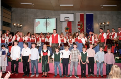
i.B. TMK Oberalm