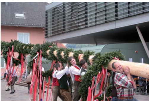
i.B. Maibaumaufstellen

Trotz mittelmäßiger Wettervorhersage stellte am 1. Mai die Trachtenmusikkapelle am Gemeindevorplatz einen Maibaum auf. Unter dem Kommando von „Moar“ Hofstätter Anton sen. (Schönbauern Toni) wurde die wunderschöne, knapp 30 m hohe Fichte in die Höhe gehievt. Den Baum gespendet hat