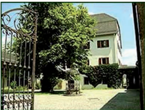
i.B. Schloss Winklhof

Das Schlossfest im Winklhof wird heuer ein ganz Besonderes! Seit Jahresbeginn haben sich die Oberalmer Vereine und Institutionen bereits mehrmals getroffen, um das Fest am 15. August 2008 vorzubereiten. Schon um 09:00 Uhr geht das Programm los. Da heißt es dann geschickt und schnell sein beim Boxenstopp, oder bei Sekt und Fleischkrappen, die Modevorführung genießen oder auch entspannt bei Kaffee und Kuchen die vielen Aktivitäten beobachten, die einem auf Schritt und Tritt begegnen. Ein Mannschaftsturnier der ganz besonderen Art erwartet Sie, das Turnier der lebendigen Riesenwuzzler, veranstaltet vom 1. Oberalmer Sportverein. Mannschaftsnennungen sind ab sofort möglich unter enes.hamidovic@utanet.at! Natürlich ist