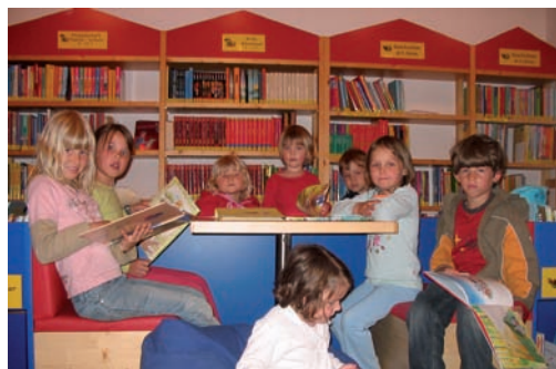
i.B. Kinder in der Bücherei Oberalm beim Lesen.

Leseratten aufgepasst! Die Bücherei Oberalm im Filzhofgütli veranstaltet heuer wieder ein Ferienspiel für Kinder. Diesmal geht es um eure Lieblingsbücher! Start ist am Freitag, den 4. Juli. Holt euch euren Teilnahmebogen in der Bücherei. Jede Woche werden Gewinner gezogen – viele Preise warten auf euch!