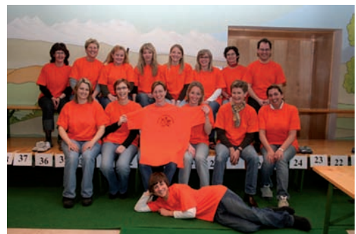
i.B. mit selbst kreierten T-Shirts und neuem Logo

Bei der 13. Börse wurden 3790 Artikel angeboten, davon wurden 1598 (neuer Verkaufsrekord) verkauft. Der Einbehalt von 20 % des Verkaufspreises sowie der gesamte Erlös des Buffets ermöglichten es uns, € 1000,- an eine Oberalmer Familie zu übergeben, bei der der Vater bei einem Motorradunfall schwer verletzt wurde. Fast bei jeder Börse können wir einen neuen Rekord erzielen - diesmal war es die Anzahl verkaufter Artikel. Das zeigt uns, wie gut diese Veranstaltung angenommen wird und steigert ständig unsere Motivation.